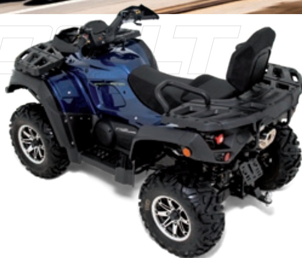
BLADE 1000 LT FL EPS Dunkelblau Metallic

Robuste Materialien, durchdachtes Design und höchste Verarbeitungsqualität - mit einer Vielzahl an hochwertigen Ausstattungsdetails ist das BLADE 1000 LT FL EPS optimal für den Einsatz im Gelände, im Forst- oder Landwirtschaftsbetrieb oder für die ausgedehnte Urlaubstour ausgerüstet.