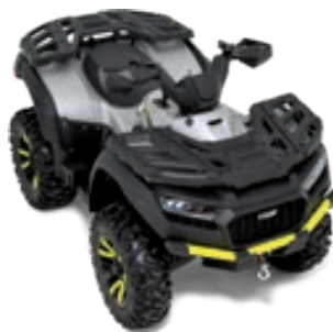
BLADE 600 FL EPS SILVER EDITION Ice Silber Matt / Gelb

Getreu dem Motto „Play Different“ ermöglicht die TGB EVOLUTION Kollektion mit vielen neuen Lackierungen und perfekt abgestimmten Designs höchste Individualität bei der Fahrzeugwahl.