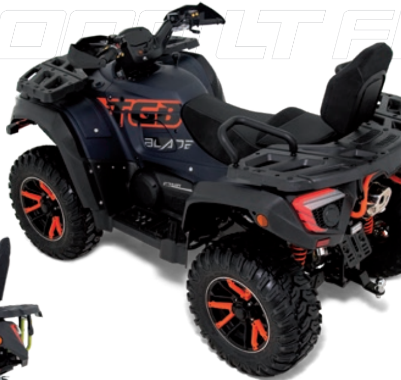
BLADE 1000 LT FL EPS MAX TOURING Racingblau Matt / Orange

Mächtiger Auftritt, hochwertige Komponenten und funktionelle Komplettausstattung: die BLADE 1000 LT FL EPS MAX Modelle lassen keinen Zweifel darüber aufkommen, dass es sich hier um die ATV-Königsklasse handelt. Mit langem Radstand, verlängerter Sitzbank mit Rückenlehne und beeindruckender Ausstattung ist auch im Sozusbetrieb und auf ausgedehnten Urlaubsfahrten höchster Fahrkomfort gesichert.