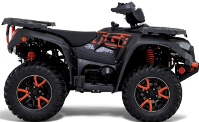
BLADE 600 FL EPS TOURING