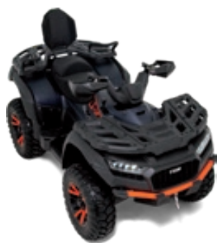
BLADE 1000 LT FL EPS MAX TOURING Racingblau Matt / Orange