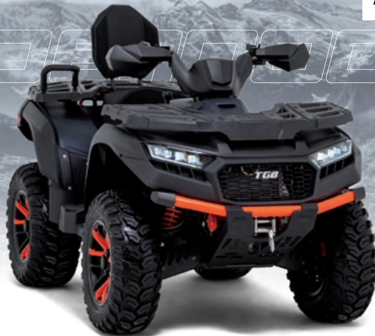
BLADE 1000 LT FL EPS MAX TOURING Racingblau Matt / Orange