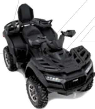
BLADE 1000 LT FL EPS Schwarz Matt