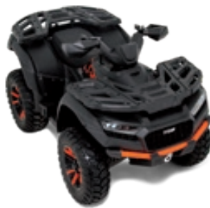
BLADE 600 FL EPS TOURING Schwarz Matt / Orange