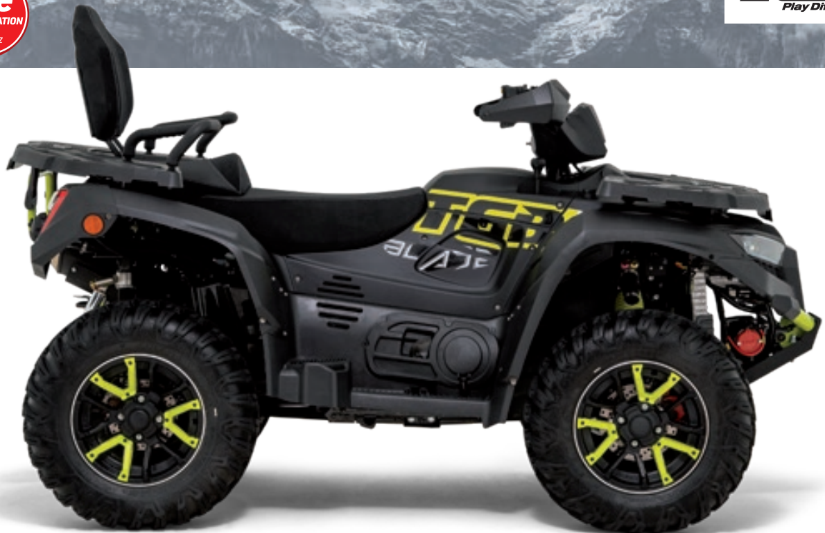
BLADE 1000 LT FL EPS MAX TOURING Schwarz Matt / Gelb