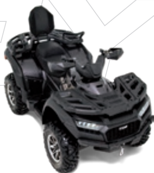
BLADE 1000 LT FL EPS Quarzgrau Metallic