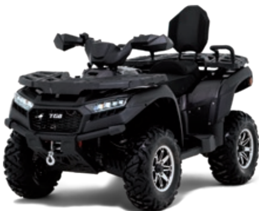
BLADE 1000 LT FL EPS Quarzgrau Metallic