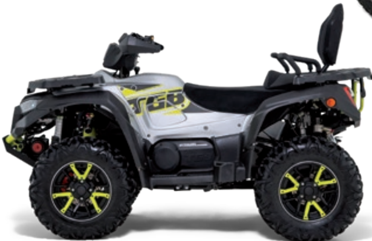
BLADE 1000 LT FL EPS MAX Ice Silber Matt / Gelb