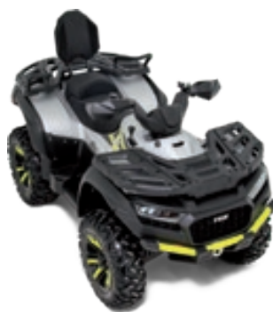
BLADE 1000 LT FL EPS MAX Ice Silber Matt / Gelb