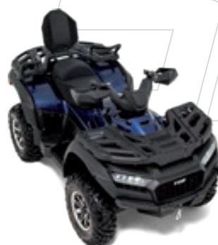
BLADE 1000 LT FL EPS Dunkelblau Metallic

DIE TGB EVOLUTION MODELLPALETTE: MAXIMALE VIELFALT IN SACHEN AUSSTATTUNG, DESIGN UND FARBE.