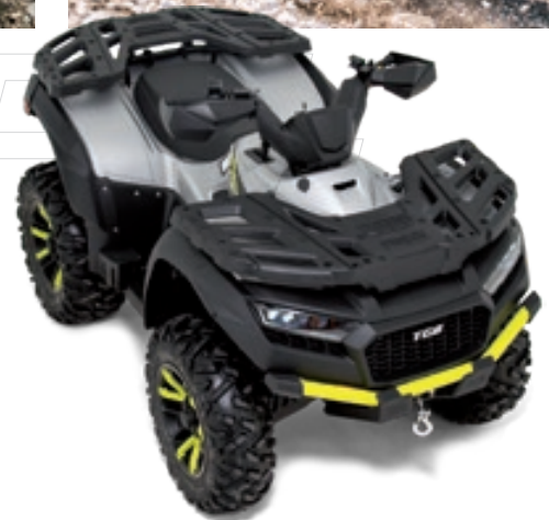
BLADE 600 FL EPS SILVER EDITION

Modernste LED-Lichttechnik mit neuem EVO-Rücklicht, Farb-TFT Display, robuste Kunststoff-Gepäckträger, mattschwarze 14-Zoll XTC Aluminiumfelgen, Seilwinde, Sport-Auspuffanlage, abnehmbare Anhängerkupplung, versperrebaare Staufächer, 12V-Steckdose... die hochwertige Ausstattung des BLADE 600 FL EPS lässt keine Wünsche offen.