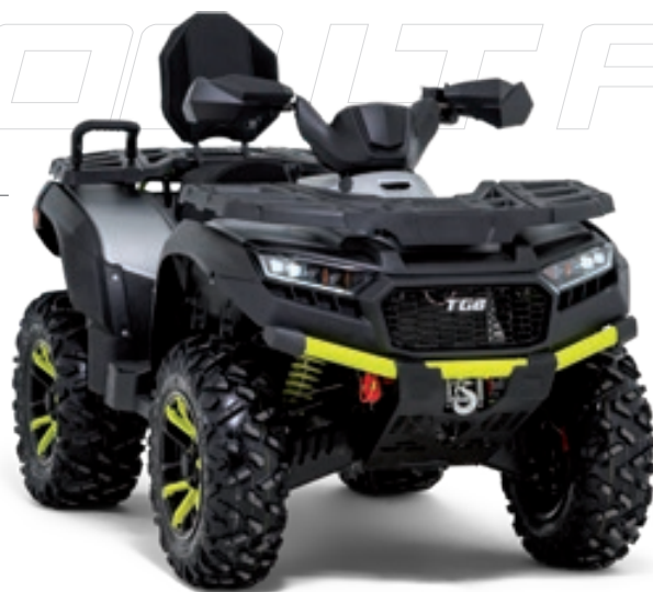
BLADE 1000 LT FL EPS MAX

Dazu kommen das neue Farb-TFT Display, modernste LED-Lichttechnik für Scheinwerfer, Blinker und Rücklicht, eine hochwertig verarbeitete verlängerte Sitzbank mit Rückenlehne, robuste Kunststoff-Gepäckträger, XTC Aluminiumfelgen mit Farbeinsätzen und viele weitere funktionelle Ausstattungsfeatures, die jedes BLADE 1000 LT FL EPS MAX zum Klassenmeister machen.