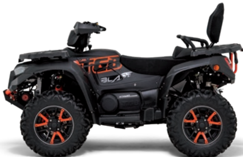
BLADE 1000 LT FL EPS MAX