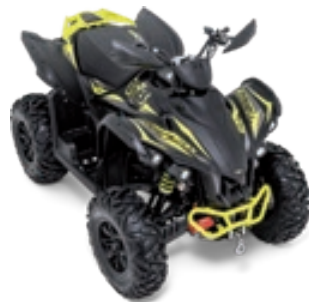
TARGET 600i EPS Schwarz Matt / Gelb