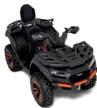
BLADE 1000 LT FL EPS MAX Schwarz Matt / Orange