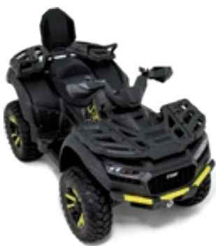
BLADE 1000 LT FL EPS MAX TOURING Schwarz Matt / Gelb