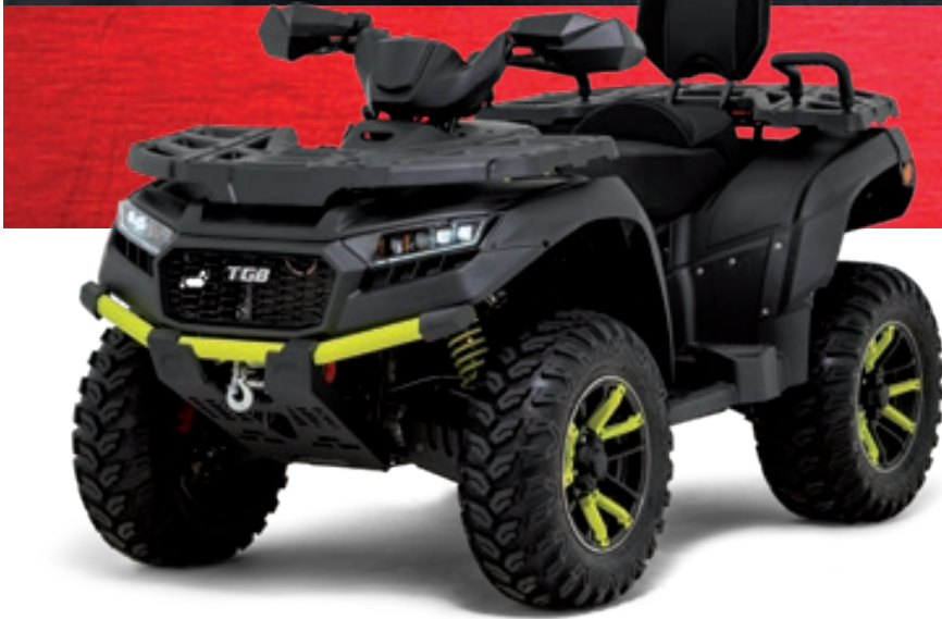
BLADE 1000 LT FL EPS MAX TOURING Schwarz Matt / Gelb